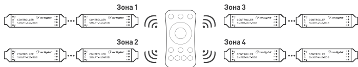
Рисунок 3. Вариант построения системы с 4-зонным пультом дистанционного управления.