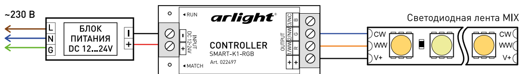
Рис. 2. Подключение светодиодной ленты MIX (CCT).