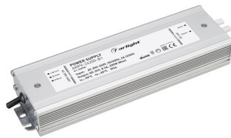
ARPV-12200-B1 ARPV-24200-B1 ARPV-24300-B1